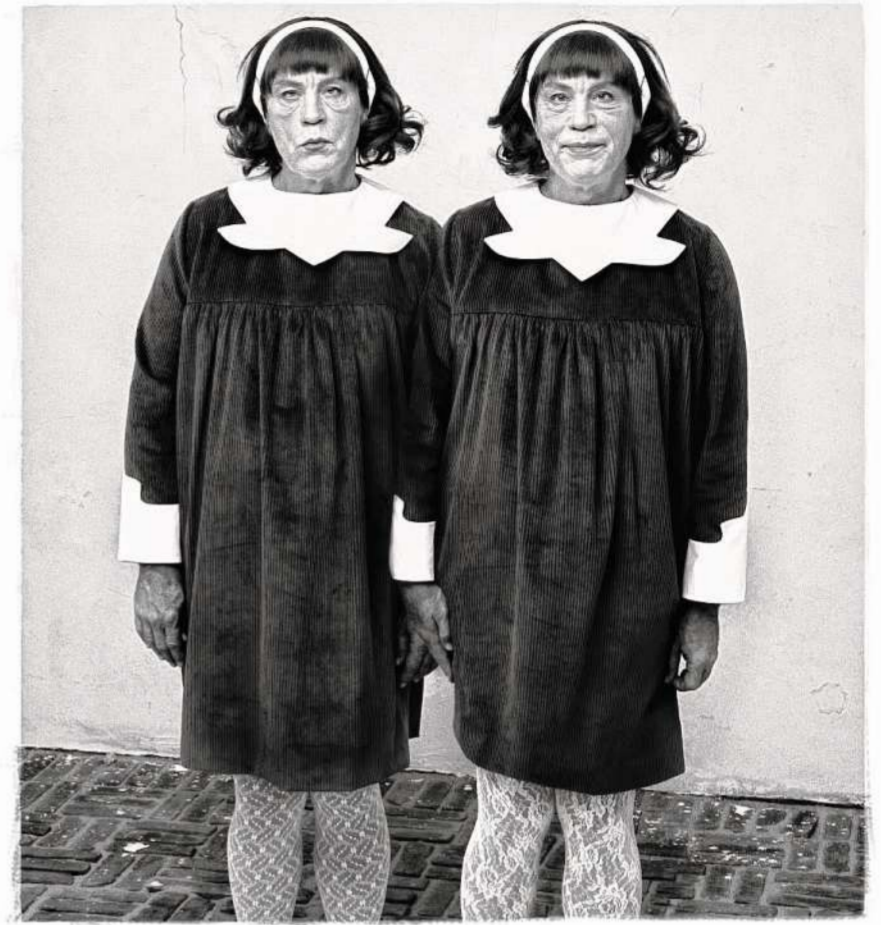
Diane Arbus: Identical Twins, Roselle, New Jersey (1967)